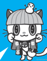
新庄商工会議所 マスコットキャラクター んだにゃん