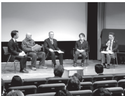
企業と市民のトークセッションが行われた

また、トークセッションが 行われ、外国人材を雇用され ている山形メタル様、ハイジ ェントテクノロジ様より外 国人材の受入・活用の現状に ついて、また地域の方より地 域のかかわり方、問題点など 今後身近に暮らす上でより良 い環境になるようお話しいた だきました。