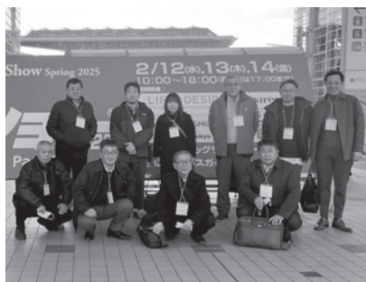
東京ビッグサイト展示会にて

また、東京ビッグサイト展示会では、自社の販路開拓や新事業の創出の場として見学をし、充実した視察研修となりました。