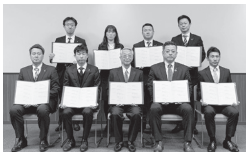
協定書を手にする各機関の代表者

本協定の締結により、円滑な事業承継の後押しとなるよう、事業承継支援機能を強化し、セミナーの開催や調査、マッチング支援等の取り組みを行います。事業承継への意識喚起を図りながら、事業者が気軽に相談できる環境を整え、地域経済の安定と発展に貢献してまいります。